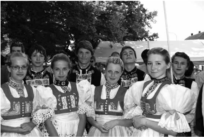
Naši mladí účastníci na Setkání Kostelců v Kostelci nad Labem

Výstup vedl zkušený „horský vůdce“, takže se nám dostávalo i výkladu o všech místních pamětihodnostech a pověstech i se zpíváním krásných hornáckých balad. Nahoře u Holubyho chaty vyhrávala slovenská CM a tak se zpívalo a tančilo, nálada byla velice jadrná a radostná a nikomu se ani vracet dolů nechtělo. Když jsme se pak po 17. hod. po skupinkách