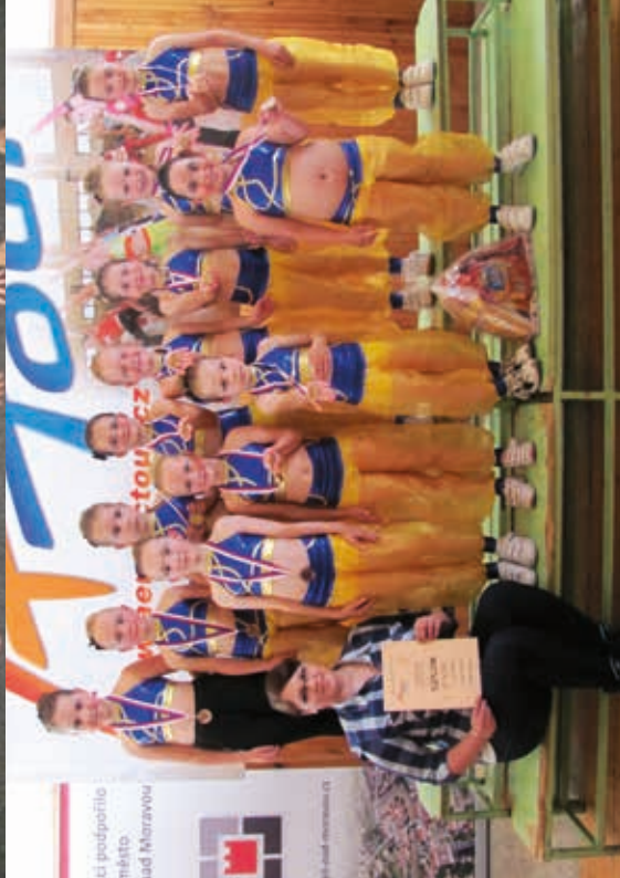
Aerobik Kostelec - úspěchy našich děvčát v roce 2013