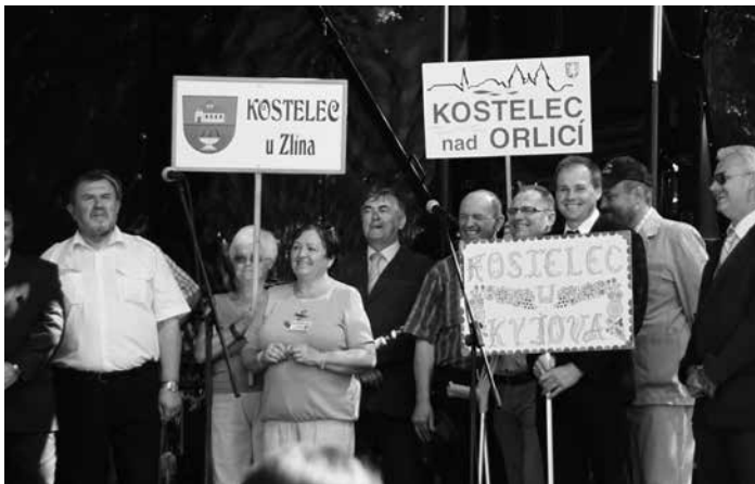
Setkání Kostelců v Kostelci nad Labem