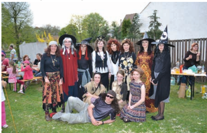
Z akce Pálení čarodějníc a stavění máje.