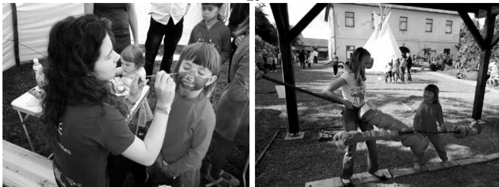
Dětský den v Kostelci na farní zahradě dne 2. června 2013, pro asi 50 soutěžících dětí, připravilo 15 skautů a skauetek.