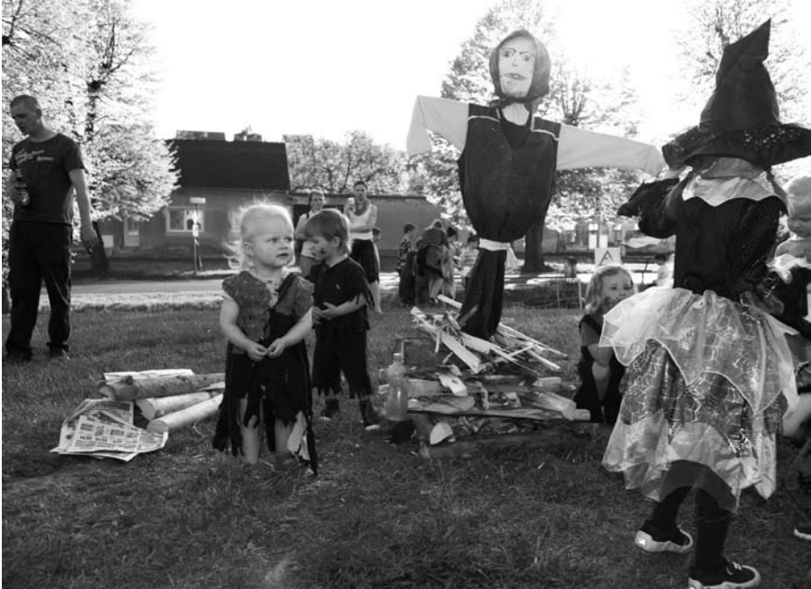
Pálení čarodějnic 2012