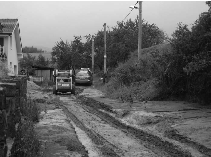
Záplavy v Kostelci z 12. na 13.6.2012.