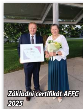
Základní certifikát AFFC 2025