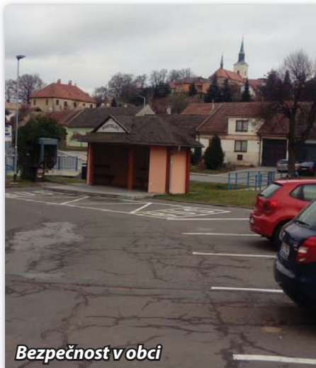
Bezpečnost v obci