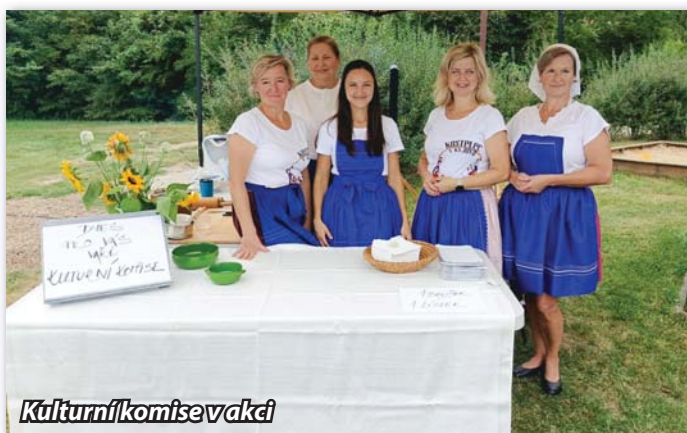
Kulturní komise v akci