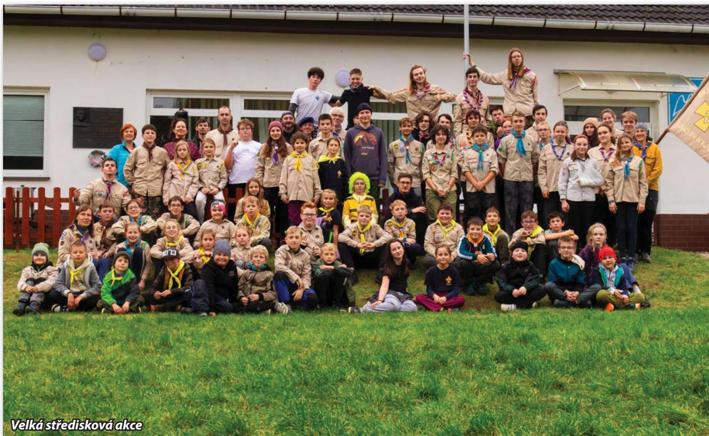
Velká středisková akce