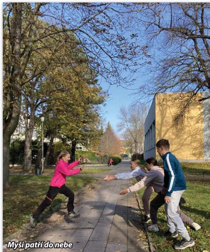
Myši patří do nebe