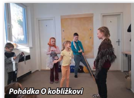
Pohádka O koblížkovi