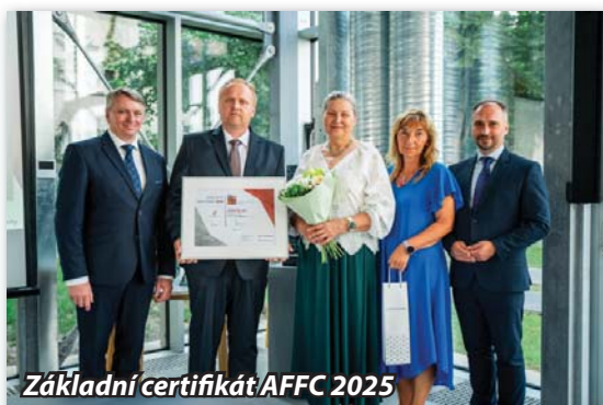
Základní certifikát AFFC 2025