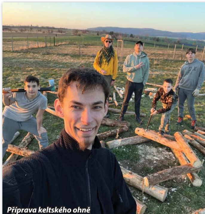
Příprava keltského ohně