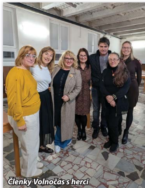
Členky Volnočas s herci