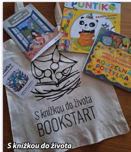
S knížkou do života