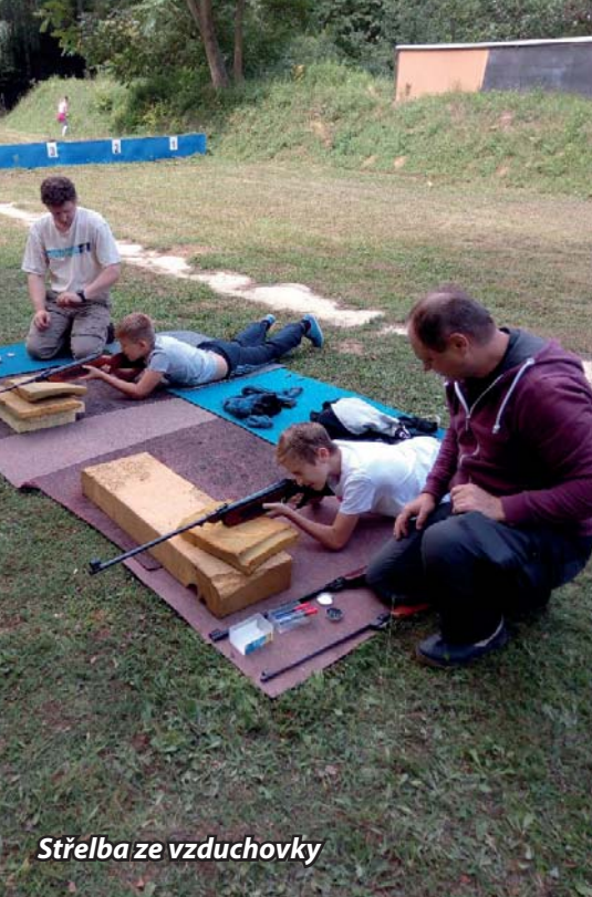
Střelba ze vzduchovky