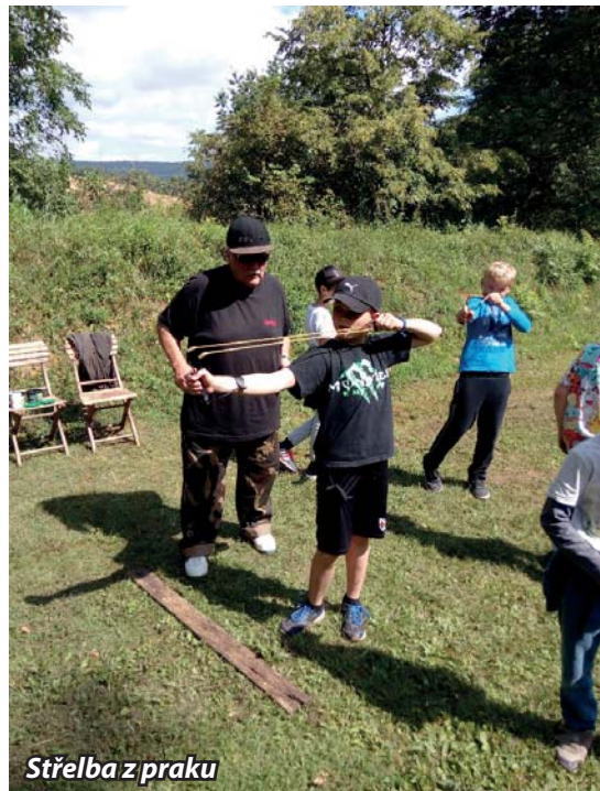
Střelba z praku