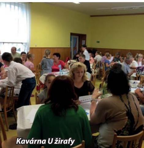
Kavárna U žirafy