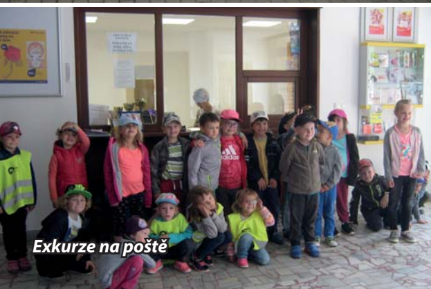
Exkurze na poště