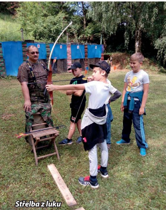
Střelba z luku