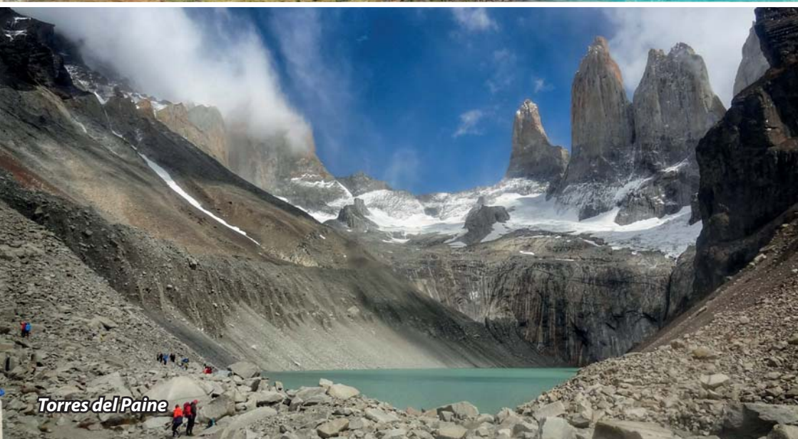
Torres del Paine