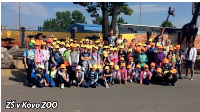
ZŠ v Kovo ZOO