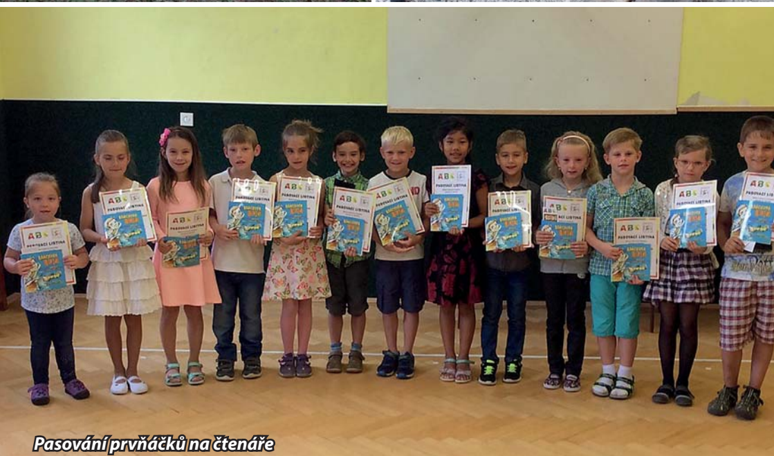
Pasování prvňáčků na čtenáře