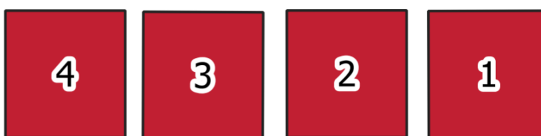
Obr. 1 - Ukázka zakreslení obsazených hrobových míst na mapě hřbitova

Grafickou část pasportu představují fotografie hrobů a přehledná mapa hřbitova s vyznačením všech hrobových míst a doplňujících prvků hřbitova. Atributy k výstupnímu mapovému listu se nachází v přílohových evidenčních tabulkách. Zakreslení hrobových míst bylo provedeno na podkladové vrstvě ortofotomapy a za pomoci katastrální mapy ve formě pravoúhelníků s číslem hrobu uprostřed, viz Obr.1 pro obsazená hrobová místa, popř. Obr.2 pro volná hrobová místa.