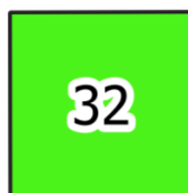
Obr. 2 - Ukázka zakreslení volných hrobových míst na mapě hřbitova